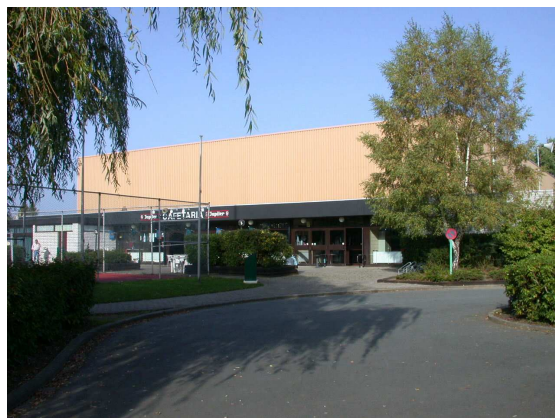
Centre Sportif des Coquerées