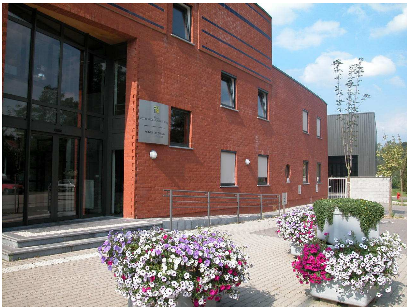
Service des Travaux, avenue de Veszprém, 5