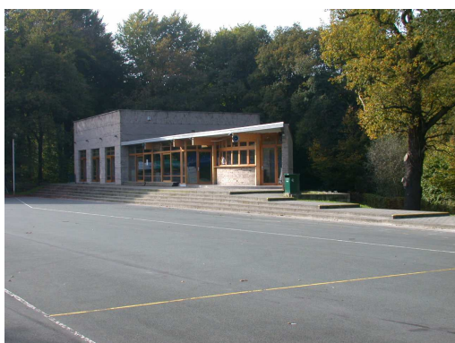
Centre Sportif Jean Demeester