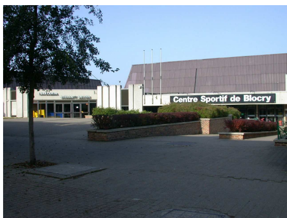
Centre Sportif de Blocry